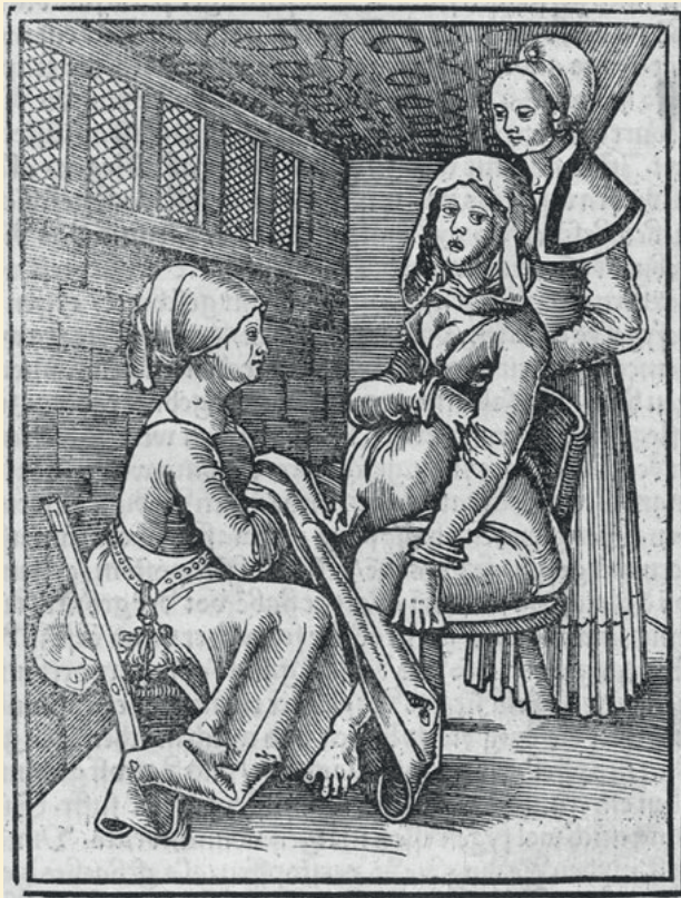
Frühneuzeitliche Geburtsszene mit schwangerer Frau auf dem Geburtsstuhl und Hebamme mit einer Helferin, in: Eucharius Rösslin der Ältere: Der Schwangern frauen und hebammen roßgarten. Worms 1513; Neudruck Berlin (Schering AG) o. J.